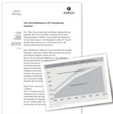
Pressenotiz und Pressegrafik

Präsentiert wurde dieses in der Versicherungsbranche so sicherlich einmalige Paket den Zurich Vertriebswegen durch den Vorstand auf einer der größten Veranstaltungen des Konzerns in Frankfurt vor mehr als 500 Führungskräften und Multiplikatoren.