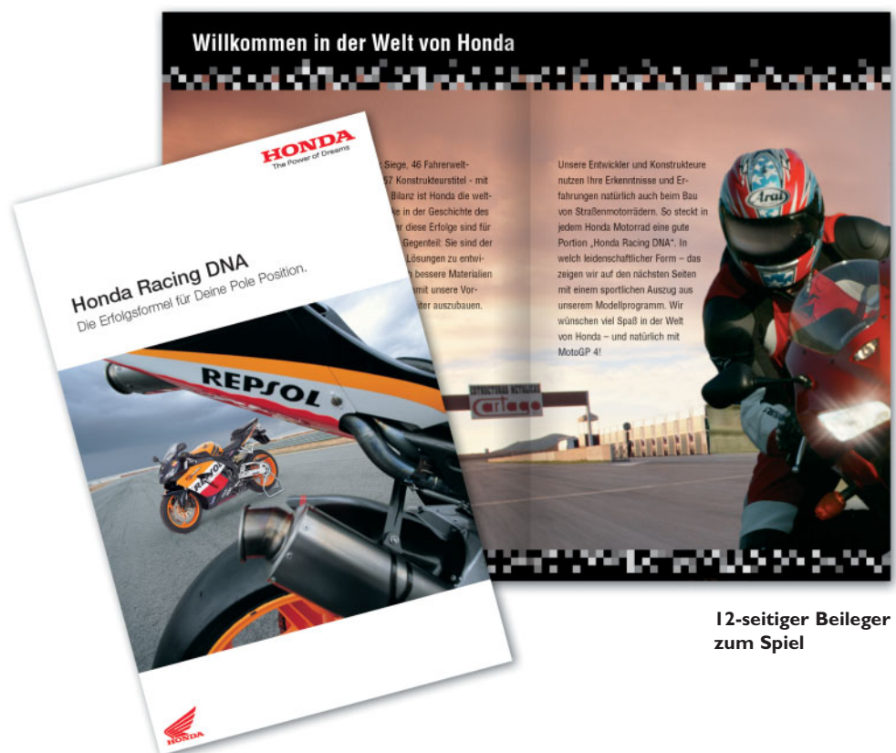
12-seitiger Beileger zum Spiel