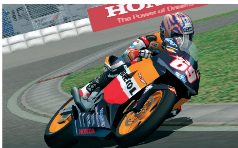
Screenshot aus dem aktuellen Spiel „MotoGP 4“

Während der Wettbewerb allein von Honda organisiert und durchgeführt wird, ist die Endausscheidung des Wettbewerbs am Sachsenring eine Gemeinschaftsveranstaltung von Honda und Sony Computer Entertainment.